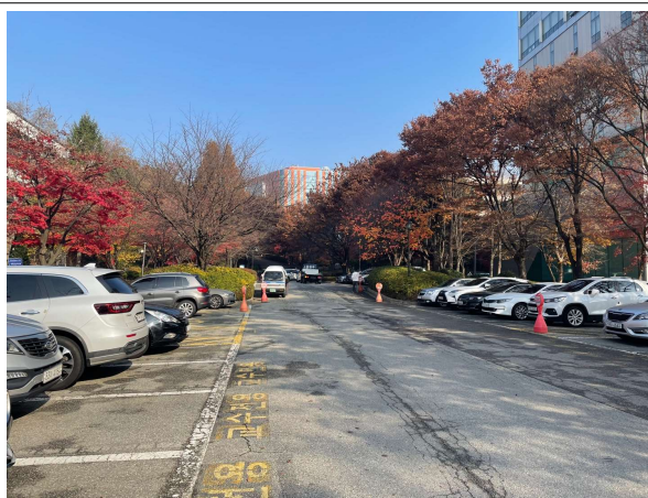
박물관 주차 공간