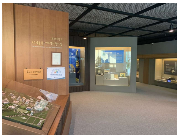
박물관 입구 2