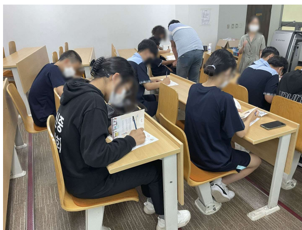
교육 프로그램 운영 사진 2