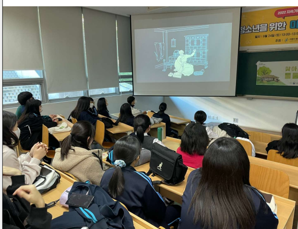
교육 프로그램 운영 사진 1