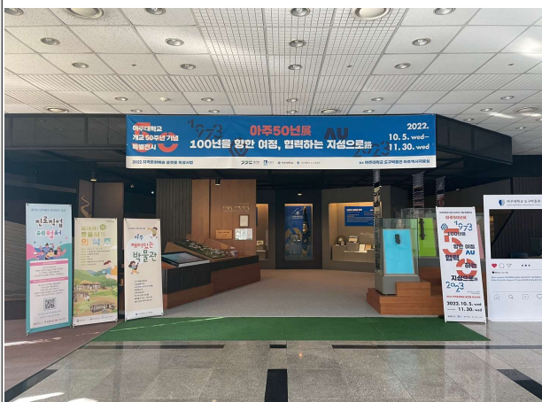
박물관 입구 1